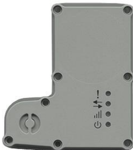
Рисунок 2.2 Светодиодные индикаторы