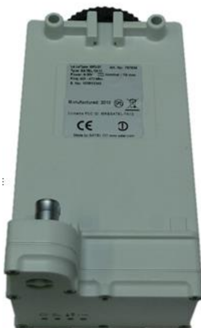
Рисунок 1.1 GFU30 радио модем для передачи данных

GFU30 состоит из модуля радиомодема (SATELLINE-M3-TR4) и платы адаптера радио интерфейса, помещенных в пластиковый корпус. Он служит в качестве сменного блока для GPS устройства Leica Geosystems.